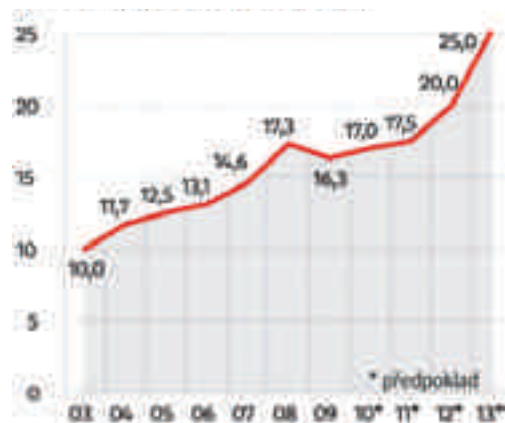
Graf č. 1 – Zvyšování spoluúčasti pacientů (v % z celkových výdajů na zdravotnictví)

Sociální demokracie je přesvědčena, že horní hranice finanční spoluúčasti pacientů by neměla přesahovat 15 %. Pravicová vláda chce rozdělit zdravotní péči na základní, tedy lacinou, a na ekonomicky náročnější, kterou si mohou bohatší zaplatit ze svého. Sociální demokracie takové rozdělení považuje za zcela nepřijatelné, neboť dělí medicínu na léčbu pro chudé a bohaté. Prosazujeme, aby ty zdravotnické služby, které odborníci označí za život či zdraví prokazatelně zachraňující, byly ekonomicky dostupné pro všechny, kteří je potřebují, bez rozdílu, zda na to mají či nikoliv. Rozhodujícím faktorem bezplatnosti musí být účinnost léčby, a ne její ekonomická náročnost.